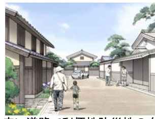
広い道路で利便性防災性の向上