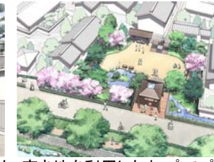
空き地を利用したオープンスペース

住まい方の提案 芹橋の歴史的景観を守りながら、ここに住まう人々の暮らしの利便性、安全性、快適性を向上させる。