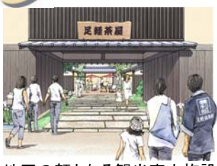
地区の顔となる観光案内施設

創る 明日 芹橋地区の風情を活かしながら、安心・安全に暮らせるよう、居住環境の向上を図る。また、住んでみたくなるようなまちづくりを展開し、活性化につなげる。