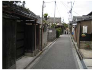
歴史を感じる1間半の路地の保存