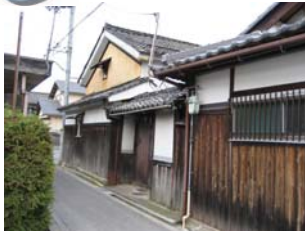
歴史的建造物の風情を活かす

守る 足軽組屋敷 古い建築物、狭い道、食い違い・どんつき道路など、善利組屋敷の風情を今に伝える歴史的町並みを保存・継承したまちづくりとする。ルートは設定せず迷路のように散策して江戸時代へタイムスリップ！