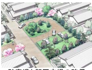
駐車場と転回広場の確保