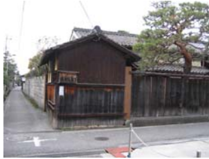
地区の観光スポットの保存