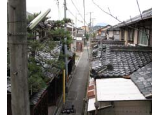
芹川からの町並みを大切に

創る 明日 芹橋地区の風情を活かしながら、安心・安全に暮らせるよう、居住環境の向上を図る。また、住んでみたくなるようなまちづくりを展開し、活性化につなげる。