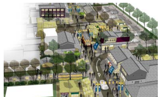
清住町通りのイメージ