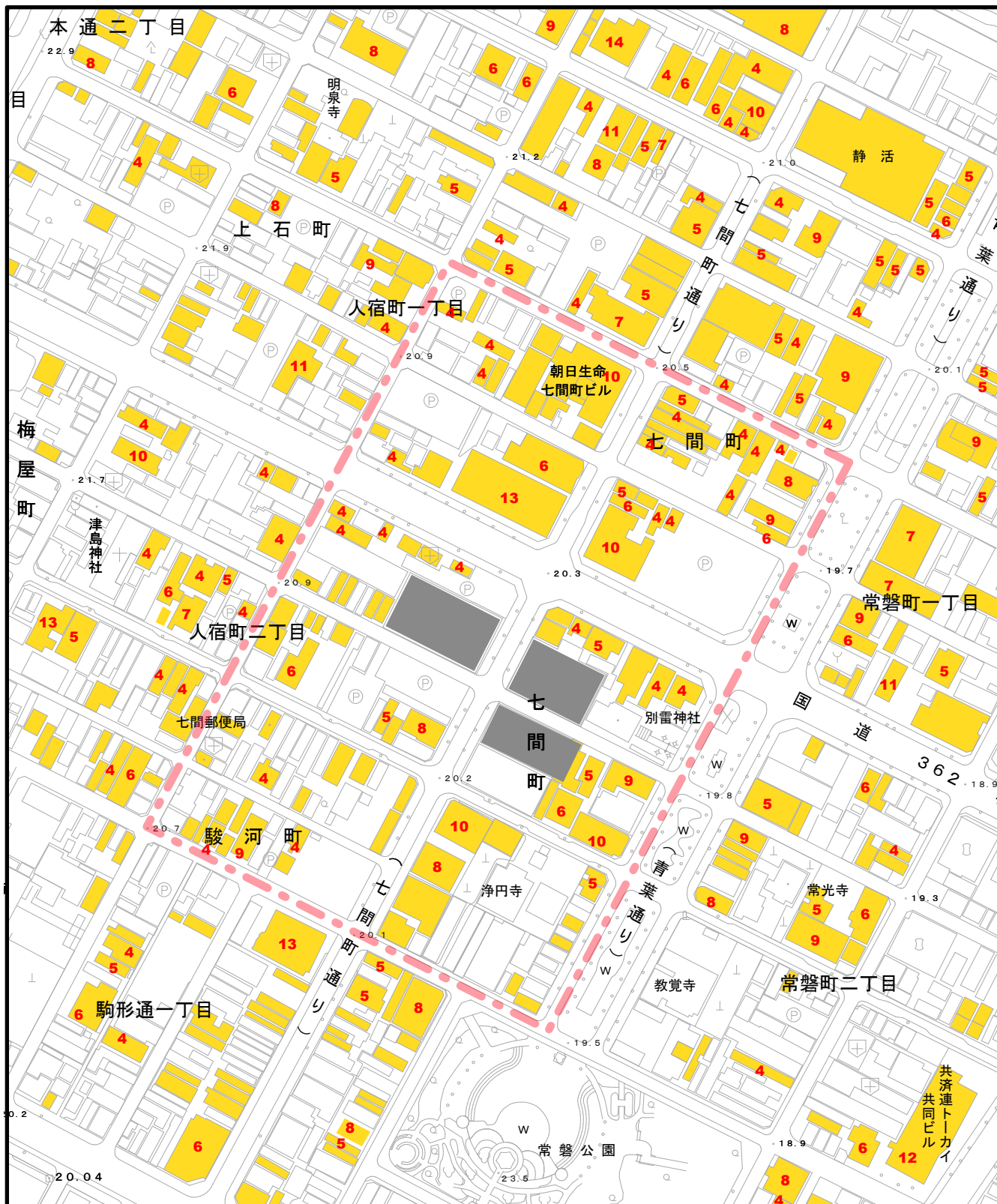
図A 対象地区および周辺地区の建物階数別分布