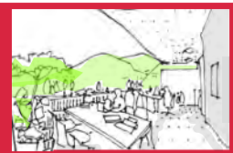
ラーニングステーション