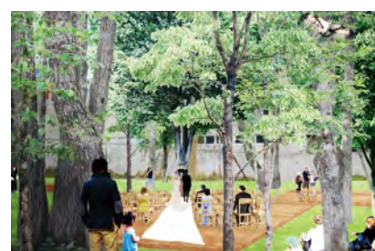
ステージのある公園

歩行者優先。ゆっくりと走る公共交通や自動車が歩行者を気遣いながら共存する。小広場と原っぱが付随する。