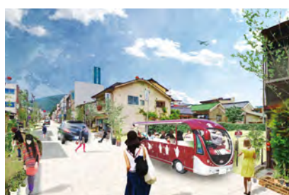
本町シェアスペース

駅前に人のための空間を創出する。駅複合施設で柔らかく囲い取られる。「谷を眺める展望台」がプラザの焦点を作る。