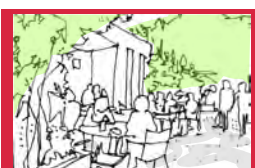
松尾町歩行者街路