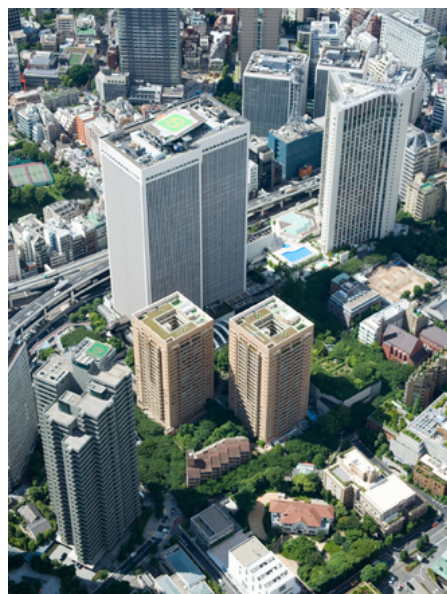
アークヒルズ地区