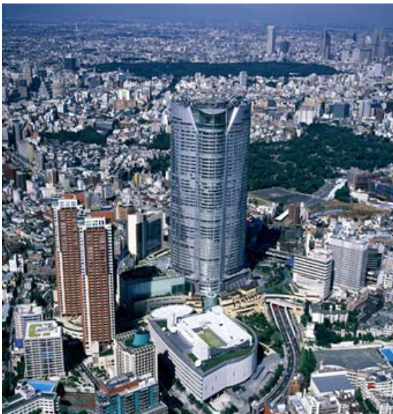
六本木ヒルズ地区