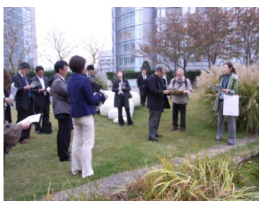
六本木ヒルズ屋上庭園