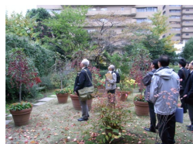
アークヒルズ屋上庭園