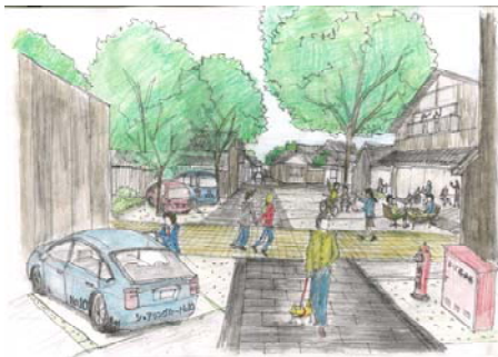
新辻と街並軸の交差点にかるむ広場が生まれる

新辻（ヨコ軸）と街並軸（タテ軸）の交差点に生まれる面を、それぞれの場所の性格に応じて広場空間として整備する。善利組スクエアは、観光の入り口であり観光客と住民や学生との交流の場として利用する。かるむ広場は、老若男女が行き交う芹橋地区の生活者のためのコミュニティ再生拠点となる。