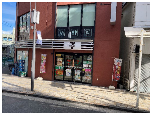
今号の写真一枚 (神楽坂上交差点付近のセブンイレブン)