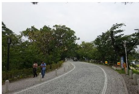
写真 緑豊かな岡崎公園 (竹千代通りを東へ)