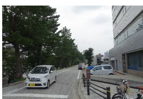
写真㉘ 明代橋北より乙川右岸沿い