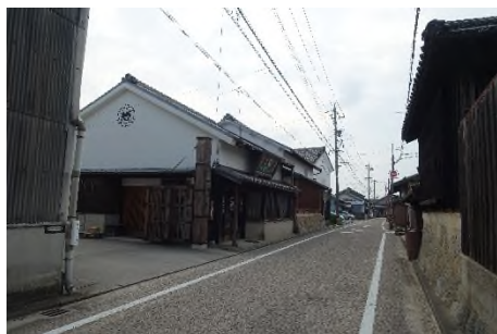
写真 八帖往還通りの 八帖味噌蔵のまちなみ