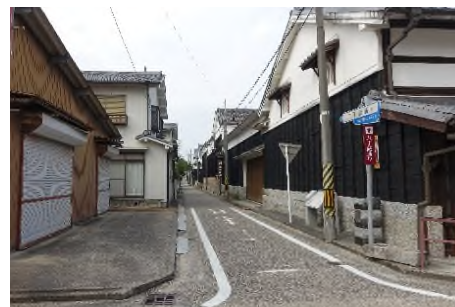
写真 八丁蔵通りの八帖味噌の蔵並み (北方向への眺め)