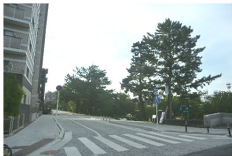
写真 明代橋南より乙川左岸沿い