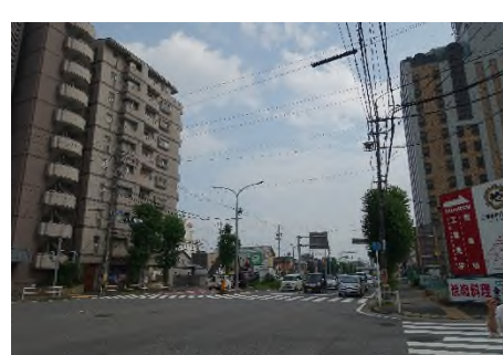
写真 国道248号(南方向への眺め)