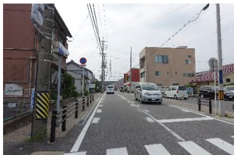
写真 国道248号を渡り八帖町へ