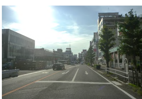
写真A 東岡崎駅前通り(東へ)