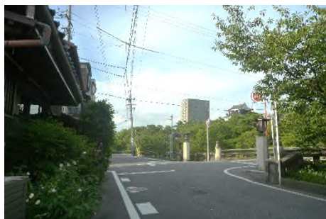
写真 板屋町より岡崎城を望む