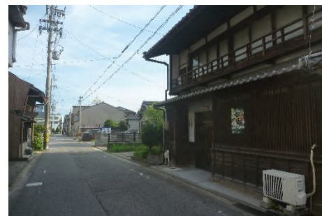
写真 板屋町に残る町屋