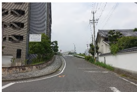
写真F 東岡崎駅前通りを抜け 桜城橋南へ