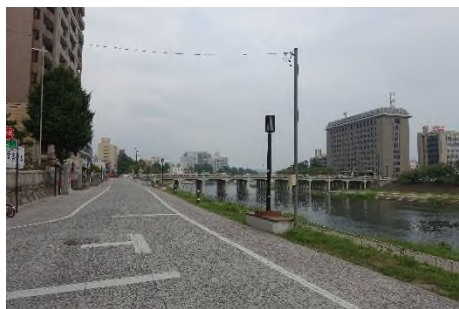
写真 乙川右岸より殿橋を望む (東方面へ)