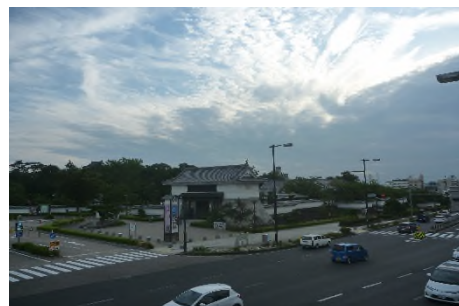
写真㉝ 国道1号に架かる歩道橋より 岡崎城大手門を望む