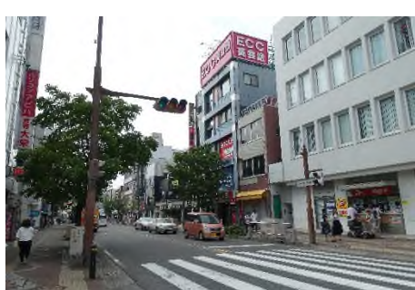
写真B 東岡崎駅前の商業ビル