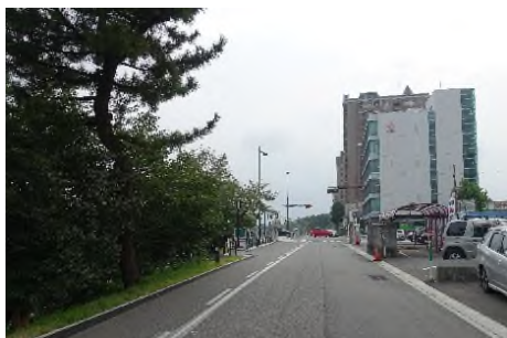
写真㉛ 乙川右岸より殿橋北へ