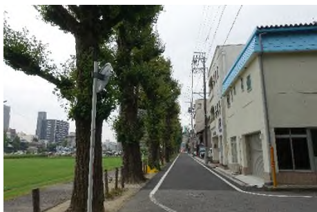
写真㉟ 岡崎公園南側の通り