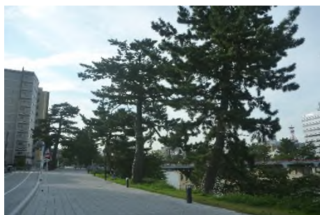
写真E 乙川左岸より明代橋南へ