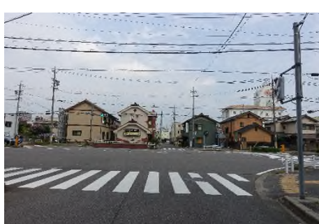
写真 中岡崎駅から板屋町を見る