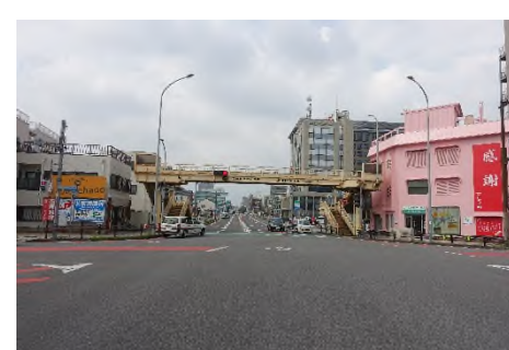
写真D 東岡崎駅前通りを抜け殿橋へ