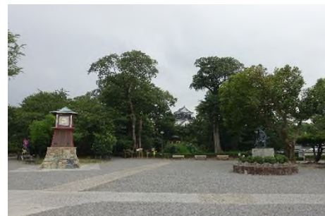
写真㉞ 緑豊かな岡崎公園内より 岡崎城を望む