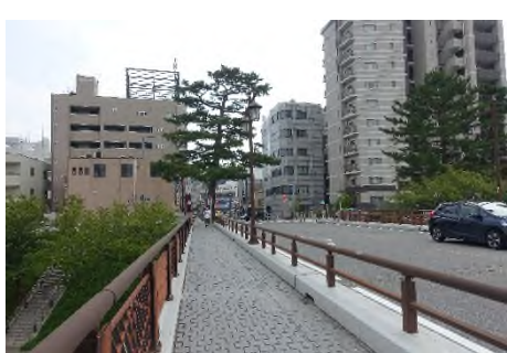
写真㉗ 明代橋より東岡崎駅へ