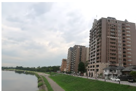
写真 殿橋より乙川右岸沿い