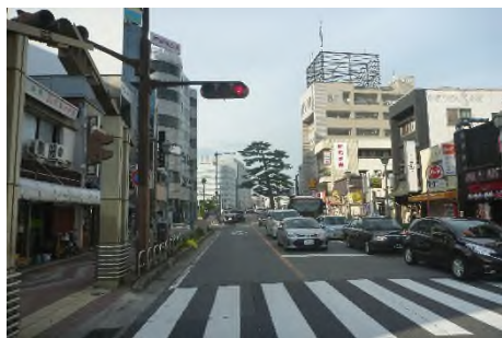
写真 東岡崎駅北口を出て北へ