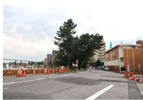
写真㉙ 工事中の桜城橋より岡崎城方面へ