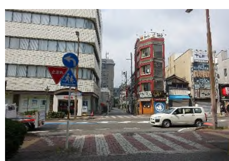
写真C 東岡崎駅前通り(北へ)