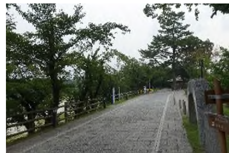
写真 緑豊かな岡崎公園 (竹千代通りを西へ)