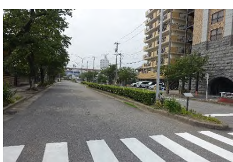
写真 板屋町を抜け 愛知環状鉄道中岡崎駅方面へ