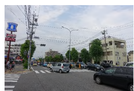
写真 国道248号(北方向への眺め)