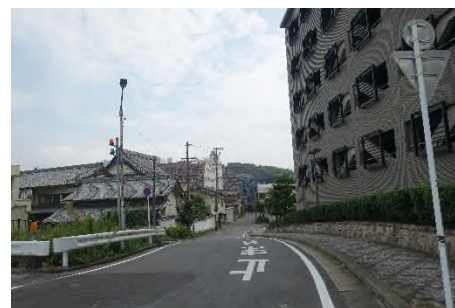
写真F' 桜城橋南より東岡崎駅方面へ