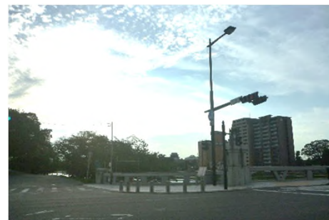
写真 殿橋南より岡崎城を望む