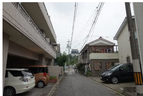
写真 板屋町の住宅街の隙間から望む 岡崎城