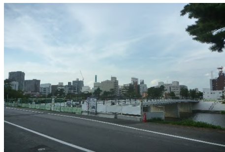
写真 工事中の桜城橋