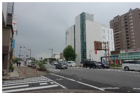
写真㉜ 県道39号より殿橋北へ