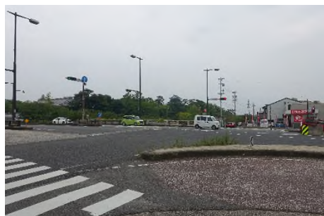
写真㊱ 国道1号西側より岡崎城を望む