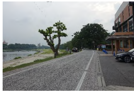
写真 乙川右岸から岡崎城方面への眺め