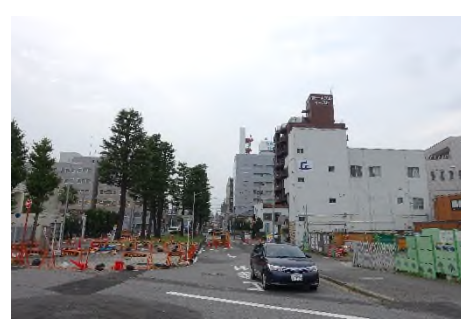
写真㉚ 桜城橋より中央緑道を望む (整備中)