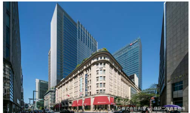
中央通り南西側からの景観。 重要文化財から連なる街並みと、現代的な高層部の対比。