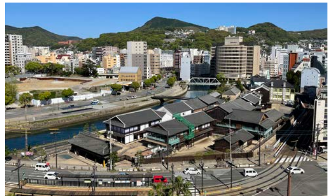
市民によって活用され、長崎市の観光交流、にぎわいの拠点となるとともに、市を代表し、市民が誇る景観となっている。

歴史都市長崎の中心部に、過去と現代が対話する素晴らしい都市景観を創出したこの事業は、まさに大賞の名に相応しいものである。(陣内)