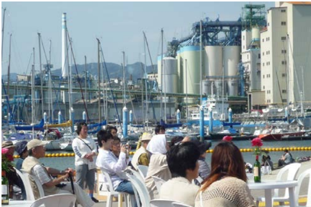
サイロ等の産業景観を背景にイベントを楽しむ様子。市民にとって近寄りやすい港から、賑わい・憩いの場へと変わっていった。