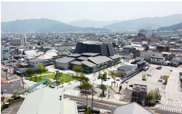
城山からの眺め。ホールの整備にあわせて既存商店街の西側(写真右)にバス停留所を移設。

地名の由来は中世にまで遡り、後に毛利氏によって築城され今もなお城下町の名残が散見される風向の良い港町である。城石垣が残る城山は街の象徴でありホールの名称にも採用されている。対象地区は近代以降商業の中心地として栄え、九州最大手の大型商業施設発祥の地として賑わいの中心であった。しかし、郊外型店舗の急速な進出によって大型商業施設が撤退し中心地の空洞化が加速した。最初の再開発計画は市民の反対運動によって白紙撤回に追い込まれた。その後市民会議の発足、専門家の参画によって合意形成がなされ、市民や高校生達の意見を取り入れた提案書が作られ、市民本位の施設実現に向けて大きく舵が切られた。中核を成す複合施設の謳い文句は「人がいる風景」である。透明性を保ち、周囲からアクティビティが見えることで内外のつながりが生まれた。食文化を広めるためのキッチンコートも市民の要望で誕生した。街並みへの連携はホール屋根の分節化や広々とした芝生広場により実現している。交通広場の移動と再編、芝生マウンドによる国道への遮蔽効果も人の場所づくりに貢献しているようだ。今後、周辺の歴史的街並みと連携した新たな回遊性が生まれることに大いに期待したい。(富田)