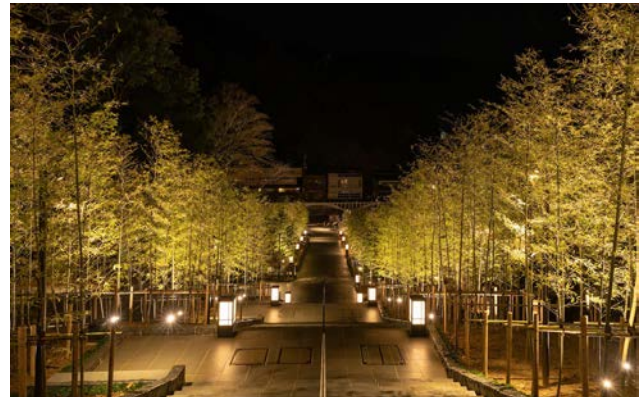
駐車場から雁木広場までを結ぶ竹林の階段。夜間は幻想的な空間となる。