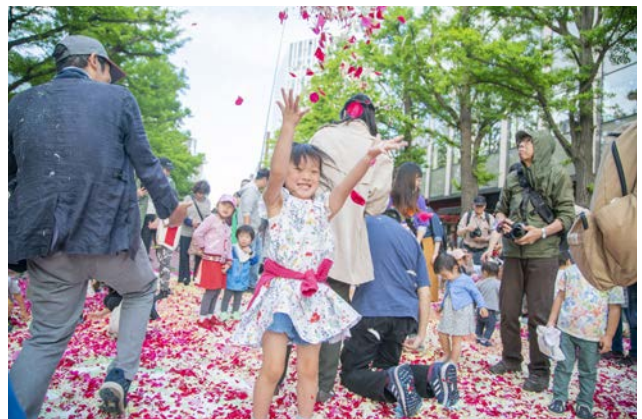
フラワーカーペット内に入って直に花びらに触れることができるフリーウォーキングの様子