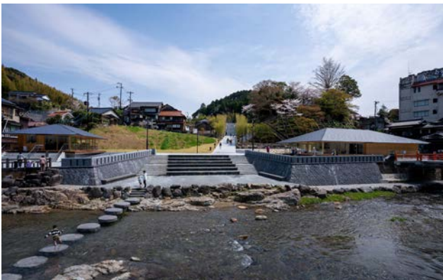
雁木広場は、自由度が高く、回遊性と川辺の景観を楽しむ空間を演出。再建された恩湯（右）と長門市の食材が味わえる恩湯食（左）