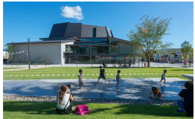
ホールの北側には広場(さくらごろごろパーク)が整備され、子ども達の日常的な遊び場となっている。