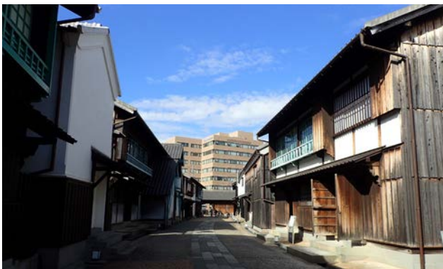
2020年に撮影した出島内の様子。写真正面に写る水門まで復元建物による歴史的まち並みが続いている。