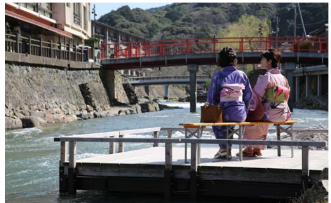
川のせせらぎを聞きながら開放的な空間でくつろぐことのできる川床。