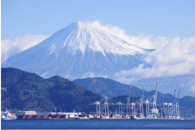
シンボルカラーによりデザインされたガントリークレーンが、富士山と調和した景観を形成している。

港湾を管理する県、まち全体に責任を持つ市、物流・工業・商業などを営む事業者、将来を担う若者たちを含む市民、全体を見渡す専門家。港にかかわる全ての主体がそれぞれに磨き上げた清水港は現代日本を代表する美しいみなとまちである。（福井）