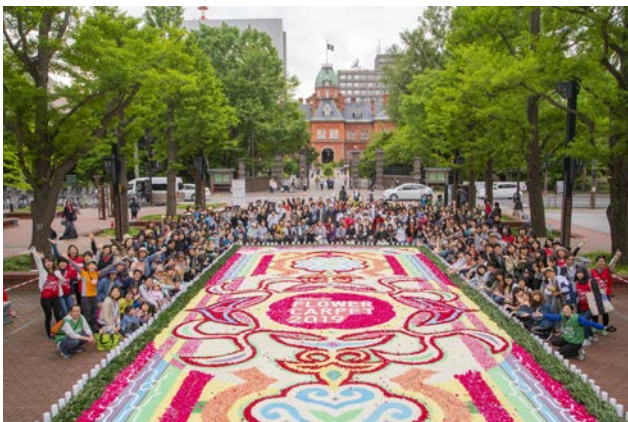
フラワーカーペット完成後に撮影した、制作ボランティアの集合写真

広場オープン時にイベントとして開催されたフラワーカーペットが好評を得たため、翌年実行委員会を設け、地元企業の協力や寄付を得ながらすでに5年実施してきている。実施にあたっては、当日のボランティアはもちろん、制作リーダーの育成、地元の大学へのデザイン依頼など、地域への働きかけも積極的に進めている。また、開催場所も民間の公開空地や屋上広場等すでに4箇所に広がりつつある。魅力的な都市広場において市民参加型で活用する事業を企画運営し、札幌を代表するイベントとして展開させてきたことは、高く評価することができる。今後もアイデアあふれる広場の利活用を期待したい。（卯月）