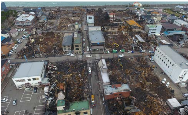
手前が南側、奥手の日本海が北側。平成28年12月22日の糸魚川市駅北大火直後の平成28年12月25日撮影。糸魚川駅北大火では約4ヘクタールを焼失。

地方都市の人口減少と空洞化は残念ながら現実である。そこが災害に見舞われた場合の復興は、この現実が加速することを踏まえて臨まねばならない。糸魚川市駅北地区はまずこの文脈において注目できる。歴史的蓄積のある街中が焼失した後のまちづくりは、意思決定の迅速化を最優先するため小規模単位で進め、空地の創出を恐れずむしろ積極的に市が確保した。そうしてできたランダムな公共空間をどう使うかの視点から、連鎖的なまちの営みをエンカレッジする仕組みと空間整備を並走させる。まずマスタープランと空間整備、次に活用というプロセスとは大きく異なり、現実を見据えたチャレンジである。その成果は核となるキターレから離散的にまちの随所に景観として実を結び始めている。見るべきははまだ整備中の街路景よりも、ここでこうしたいというやる気が見せる場の景である。災害復興に限らず、現代日本の都市景観形成のあり方に一石を投じた事例として特別に高く評価したい。（佐々木）