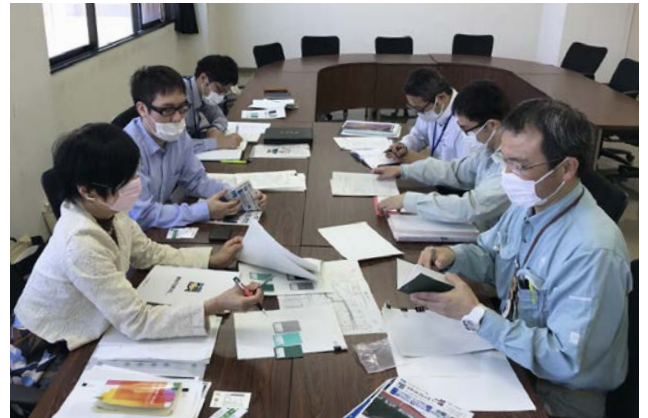
毎月実施する色彩相談会において、事業者と協議しながら取組を進めている。