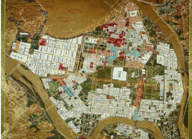
古地図と現代の地図を重ね合わせたもの

萩市は、地形的な特色から江戸時代の地図がそのまま使え、古代から藩政期・明治維新さらに現代へと連綿とつながる「時」が日常やまちの表情を彩っている、『まちじゅう屋根のない博物館』である。その彩りは「まち歩きボランティア」による「対話型」案内で理解が深まる。昭和時代に地域の資産価値に気づき、歴史的景観保存条例を制定して景観の保存への努力を積み重ねてきた上に、「萩まちじゅう博物館条例の制定」による地域のプライドを醸成してきたことは高く評価できる。条例に曰く、萩にしかない宝物を次世代に確実に伝え、「萩を終の住処にして良かった」と日々実感できるような魅力あるまちづくりに努め、萩を訪れた人々に萩の良さや歴史を、愛着と誇りを持って伝えることで、「日本の心のふるさと」と思われる、おもてなしをまちじゅうで推進することを決意し、暮らしを美しく育てている「風」が風土・風景・風格・風情を生み出し、おもてなしのスピリッツがにじみ出ている点も高く評価された。次世代への「知の継承」がいつそう推進されることを期待したい。(小澤)