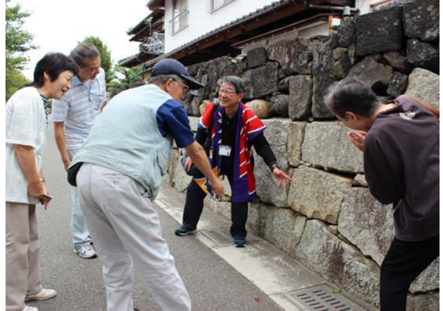
堀内伝建地区のガイドツアーの様子