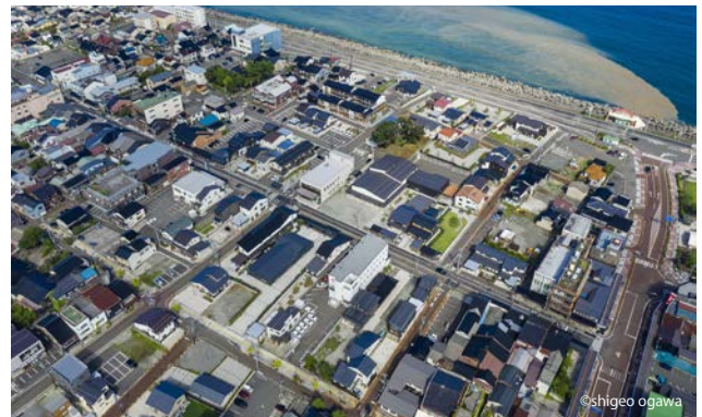
上が日本海側（北）で、下が糸魚川駅側（南）。中央の東西に横断している通りが「本町通り」。駅から日本海に連なる市民公園が整備されている。