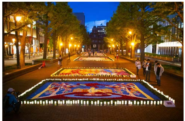
フラワーカーペットのまわりにキャンドルライトを灯して演出している様子