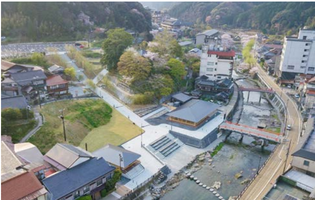
当地区は、音信川沿いに広がる県内最古の歴史をもつ温泉街である。

対象地区は山口県の日本海に近い山あいの小さな温泉街である。地域再興のため、外部の著名人等呼び込み再整備を進めるといった方法は良くみられるものの、そういった方法で成果を挙げられる場所はある程度限られるように思うのだが、当地区は少し状況が異なる。一つは全国温泉地のトップ10入りを目指す、というややとてつもない目標が掲げられていることである。それが外部の有能な人々を惹きつけ、地域の力にしたのではないかと思える。また全国で活躍しているこの外部の人たちの多くが、自ら資産を持つという形でこの取り組みに参加している状況にも着目される。計画や作られた景観について評価すべきは、思い切った計画を躊躇なく実行したこと、といえるだろう。当初描かれた全体構想は、対象とされた土地の範囲を超え、温泉街の他の人の土地にも遠慮なく描かれ、そして実行された。そしてかなり手の込んだ照明計画もまた、実行された。総じてデザインは高いレベルを保っているものの、一部にはやや疑問を持つ解答も含まれる。しかしながらそれを超える充実されたソフト面での取り組みと成果も含め、優秀な取り組み例として評価した。（高見）