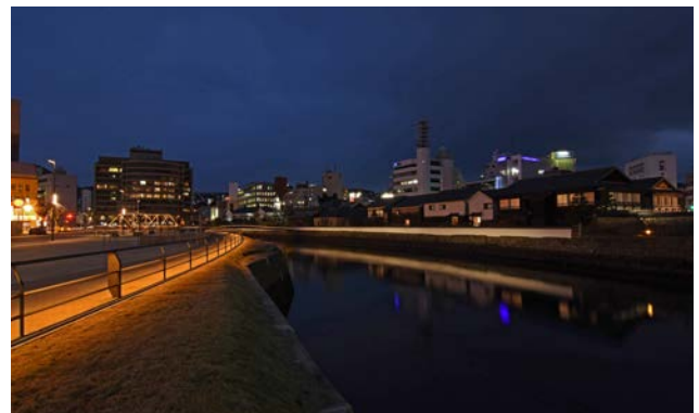
出島、出島表門橋、出島表門橋公園をそれぞれ管轄する3つの部局を超えて一体的にデザインした夜景。