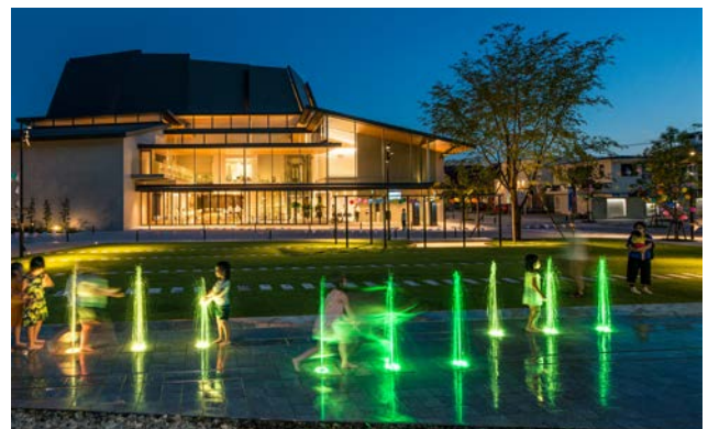
夜間は透過性の高いホールからの明かりや内部で活動する人々の様子が地区内の景観演出に寄与している。