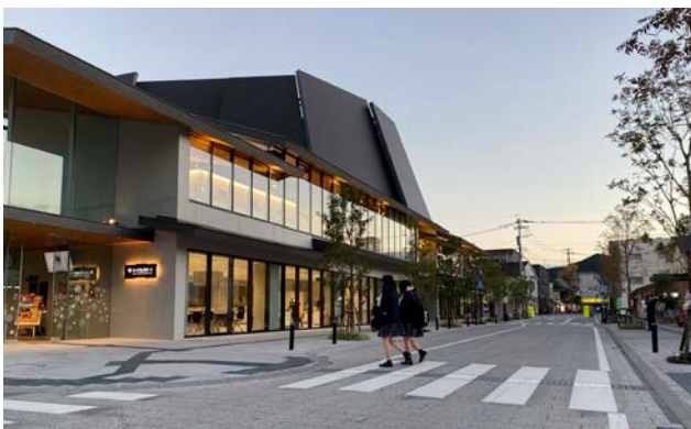
市道側はホールの軒が低く抑えられ、落ち着いた質感の舗装で船頭町まで続いている。