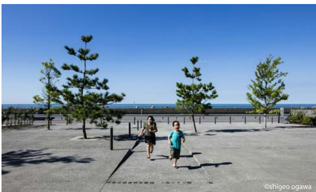
日本海に最も近い大町潮風市民公園