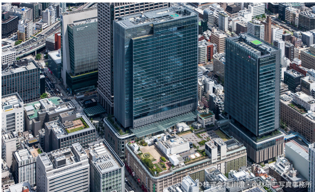
南西側鳥瞰。 手前のB街区、右のA街区、左奥のC街区、その奥に隠れたD街区の一体的開発。

都心部における重要文化財を活用した都市再生プロジェクトとして良質な都市景観を形成しており、十分に「優秀賞」受賞に値するプロジェクトであると判断される。（岸井）