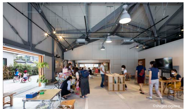
地域の核の1つとなる駅北広場キターレ