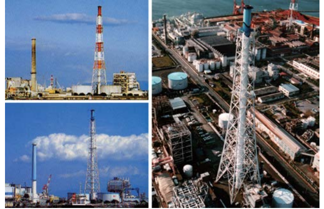
赤白からシンボルカラーへ塗り替えられた煙突。地元住民・事業者・行政が一体となって実現した、計画を象徴する取組。