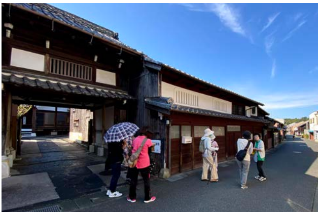
浜崎伝建地区でのガイドツアーの様子