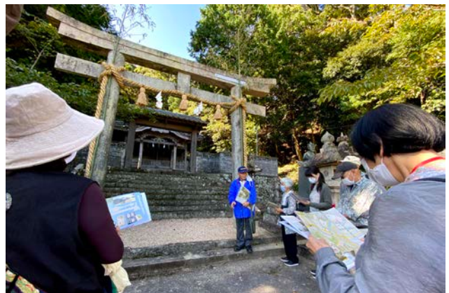
須佐武家町でのガイドツアーの様子