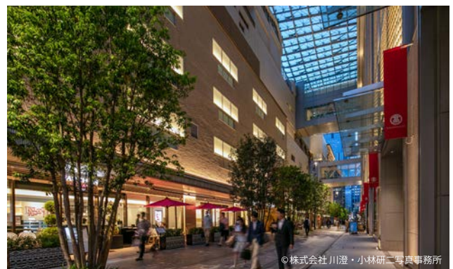
日本橋ガレリアを東から見る。 車両出入口や通用口のあった裏通りが、賑わいの核へと変貌した。