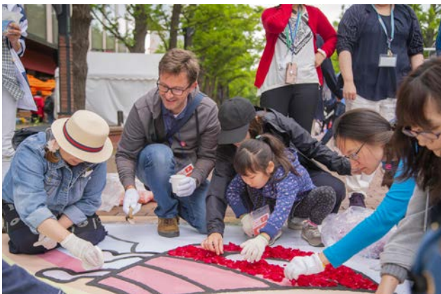
下絵に沿って花びらをならべる作業の様子