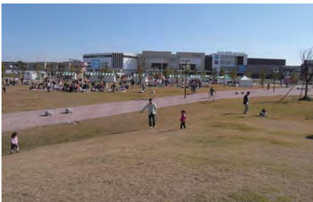
2.6ha と広大な「見田方遺跡公園」で遊ぶ人たち。大規模なイベント等で活用できるようオープンスペースを整備。