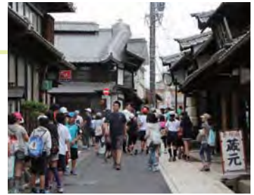
地元小学校と協力してまち歩きワークショップの開催。小学生は夏休みの課題として熱心に勉強。

この地区は景観計画重点地域に指定されている。景観計画の運用では民間建築への規制に重きが置かれがちであるが、ここでは上記の活動によって中山道の歴史的風景の再創造につながっていることが評価できる。（福井）