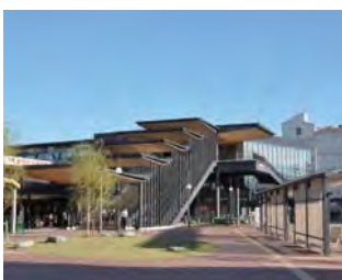
大賞：西鉄柳川駅周辺に於ける市民・事業者・行政・専門家による景観まちづくりの取り組み 福岡県柳川市（西鉄柳川駅周辺地区）