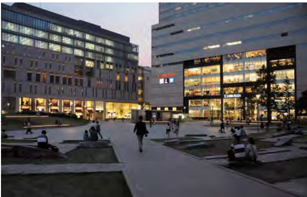
演出照明の組み込まれたベンチ、築山撤去によって見えるようになった警固神社通りの歩行者とレゾラビル、リニューアルオープンしたソラリアプラザのファサードが園内の夜景を彩る。