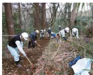
優秀賞：栗山みどりの保全事業 千葉県四街道市（たるやまの郷）