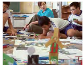
優秀賞：まちづくり総合学習 福島県いわき市（久之浜・大久地区）