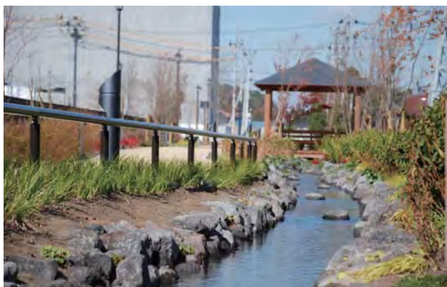
『水辺の空間』の中心をなすせせらぎの小径。「水」を通じて、潤い・賑わい、そして大切さを感じとり、時の流れとともに表情を変える美しい水景が日々の暮らしの中にとけこみ、再び穏やかな暮らしが送れるようにと整備された。

今後、被災者の皆さんがこの地で新しいコミュニティを育み、一段と質の高い景観まちづくりに協働で取り組む日が一日も早く来ることを期待して、ここに特別賞を授与するものである。（岸井）