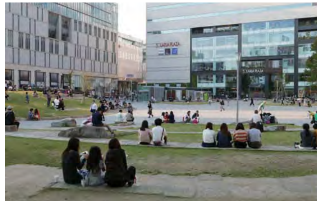
公園南側からみた新公園の様子。より広がった中央広場では市民や企業によるイベントが多数行われ、再配置した改修以前からの自然石ベンチならびに新設したみはらしの丘等、利用者の増加に繋がった。