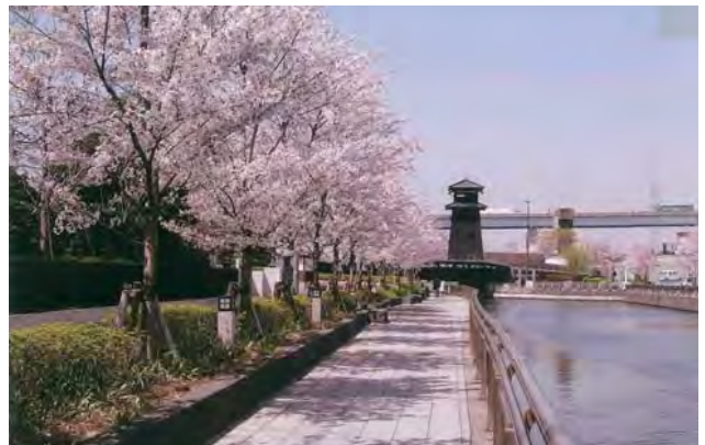
えどがわ百景 新川千本桜と火の見やぐら（西水門広場）江戸の花の象徴である桜を新川の両岸に並木状に植栽し、新しい桜の名所として潤いのある水辺づくりを実施。