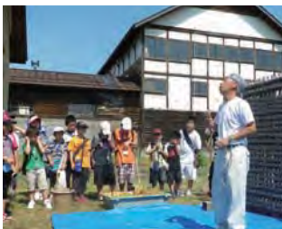
大賞：南町 2850 プロジェクト ～喜多方市小田付地区 空き家・空き地の再生～ 福島県喜多方市（小田付地区）