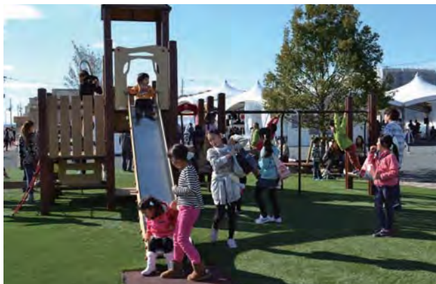
平成27年11月3日まちびらき。開放された1号公園の遊具で遊ぶ子供達の元気な声が聞こえる。