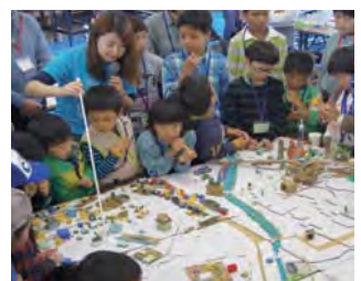
優秀賞：ふじさわこどもまちづくり会議 神奈川県藤沢市（藤沢市内全区）