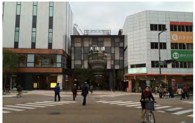
国道 11 号から大街道を望む。商業の玄関口。街路整備がなされ、民間再開発ビルの整備やアーケードのリニューアル整備を実施。