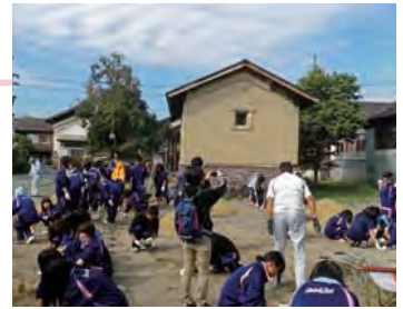
喜多方桐桜高校エリアマネジメント科 3 年生 38 名、1 年生 39 名との「芝生ワークショップ」の開催（2013 年 9 月）。

この「南町 2850 プロジェクト」は、小田付地区の表通りに面する荒廃した空き地・空き家を舞台に喜多方の蔵文化の継承活動を行う事を目的としている。高校生が地元の人や職人等のプロと一緒に、まちあるき、デザインワークショップ、施工ワークショップという一連の活動を通して、自分たちで考え、自分たちで施工するという、教室では得られない貴重な経験を積んでいる。