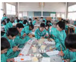
大賞：景観まちづくり 街のみんなでおもてなし「福江＊つるし飾りロード」 愛知県田原市（福江地区）