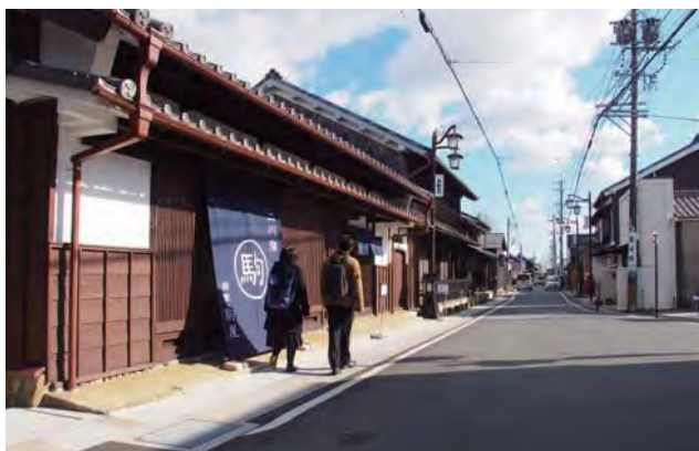
二川宿の旧東海道沿いの眺め。二川宿は、本陣、旅籠屋、商家の 3 か所を見学できる日本で唯一の宿場町である。左の建物は豊橋市指定有形文化財商家「駒屋」。

本地区の取組は、これまでの重要伝統的建造物保存地区とは異なる、よりゆるやかな歴史的な町並み環境形成に積極的に挑戦しており、特に時間をかけながら行政と住民が一体となって地道に取り組んでいる点は高く評価できる。(卯月)