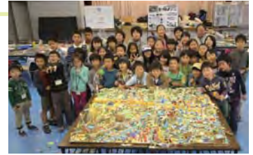
完成写真。子ども達が考えた1/500の都市計画模型を前にスタッフと一緒に記念撮影。

スタッフは、市民（建築士、行政議員、会社員など）と市内外の大学生ボランティア（早稲田大学、法政大学、東京大学、日本大学、東海大学、慶応大学、東京理科大学等）が中心となっており、市民団体や行政区の枠を超えたコラボレーション活動として数多くの受賞歴があり、藤沢の地域教育として評価されている。近年では参加した子ども達が中学生・社会人スタッフとして活動を支えるようになり、継続される理念・まちづくりの基盤が、ここ藤沢から生まれている。