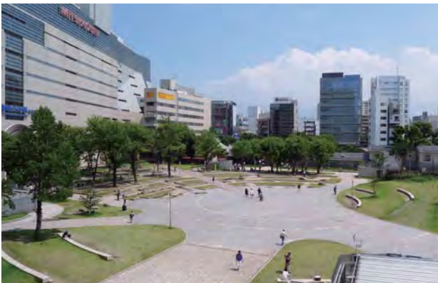
公園の再整備を機にリニューアルオープンしたソラリアプラザ・カフェからの眺め。死角を形成し、性犯罪等の発生から立入禁止となっていた築山を撤去、中央園路を新設して園内外の視線交錯と動線促進を図った。

既存の樹木を残しつつ、十分な動線・実態調査に基づいて設計された芝生広場で多くの市民がゆったりと過ごす様子は、公園再生のあり方を示すものであり、優秀賞にふさわしいと評価された。（池邊）