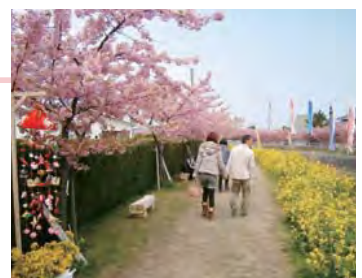
満開となった、免々田川沿いの河津桜と菜の花を見ながら週末には多くの観光客が散策。

このような状況の中、当協議会が中心となり、景観ガイドラインの策定に向けた取り組みや、「福江*つるし飾りロード」を中心に地域の自然や菜の花を活用した景観教育や景観まちおこしなど、地域の保育園や小学校、中学校、高校、地域住民、関係団体、行政等が協働した活動を推進している。活動を継続的に行うだけでなく、景観まちづくりを軸にした人材育成、地域の活性化に取り組むなど、活動は更に広がりを見せている。