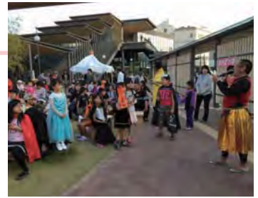
藤吉小学校父親委員会と地元美容専門学校学生が連携し、駅前広場でハロウィンイベントを開催。

そして本プロジェクトに参画した市民が主体となり、駅前利活用や活性化へ向けた新たな景観まちづくりの取り組みが生まれている。