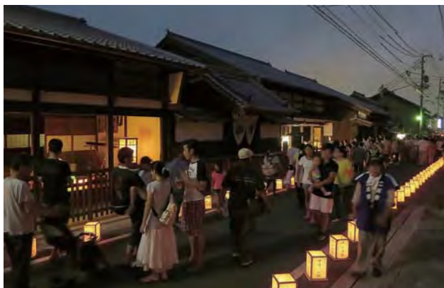
二川宿の夏の風物詩になってきた「灯笼で飾ろう二川宿」の様子。沿線に約 3 千個の灯笼が並び、幻想的なまち並み景観が生まれる。