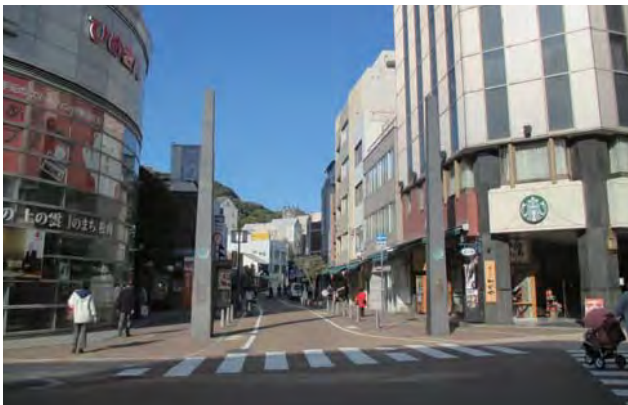
国道 11 号からロープウェー街を望む。観光の玄関口。街路整備がなされ、沿道建築物のファサードなどを改築。統一の突出し看板・オーニングテントを使用している。

「シャッター通りから生還した街」ロープウェー街は、まさにその名に相応しい場である。全国に点在する数多くの死んだ街のなかで、ここは竣工後 10 年余りを経て、見事に生き返っている。かつては、この街もまた薄暗いアーケードと、シャッターが閉まったままの店舗が続く商店街であった。しかし今、松山市民の誰もが「美しい、きれいになった」と称賛する。その、デザイン手法自体は、他の街でも「計画」されているガイドラインと大きな差異はない。「既存アーケードの撤去・店舗ファサードの素材と色彩の共通化・店舗看板のサイズの統一・突出し看板の共通デザイン化・統一オーニングの採用・オリジナルデザインの街路照明やストリートファニチュアの設置・その他多様な運営基準の設定など」そのどれを取っても特別なものではない。しかし、「徹底した実施」がなされていることが、決定的な違いだ。その背景には、この街を運営する人々の並々ならぬ熱意がある。その結果、ごく一部の例外を除き、見事な統一がなされた。そして、空き店舗ゼロという、街の活力を再生したのだ。夜ともなれば、この道を行き交う恋人たちの「とっても素敵な街ね、…」という囁きが聞こえてくる。（田中）