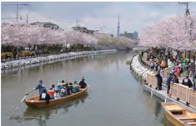
新川さくら館前、広場橋（桜橋）から西側を望む。満開の桜の中、船着場から和船の運航を行っている。

そぞろ歩きができる水辺の桜。これはもう無敵である。しかしこの黄金のコンビネーションを高密度な都市に出現させるのは容易ではない。川沿いの連続的歩行者動線、植栽空間、近い水面、沿川の街並み、休憩場所、魅力的な橋、要所のランドマーク。そして魚や鳥の姿を添えた川面。新川はこれらの基礎的条件をインフラ整備によって獲得し、地域から寄せられた約 8,600 万円の桜基金による 716 本の桜が水辺を彩ることとなった。無愛想な護岸の向こうに水が淀む状態から、老若男女の姿が絶えないまちの中心軸へ。すべて人の手、地域の手で再生された水辺は、誠に素直に心地よい場となっている。花のあるなしにかかわらず、住み、働き、訪れる人々の普段の環境の豊かさを保証している。沿川の個人や企業も自主的に景観形成に協力している。この場所を縁とした市民活動の展開も目覚ましい。こうしたポジティブな連関が生まれるのは、このプロジェクトが、現場に向き合い、人に向き合い、ひとつひとつ丁寧に考え、愛情をもって取り組んだ無名の人々の仕事の集積であるからだ。都市の公共空間デザインの規範である。(佐々木)