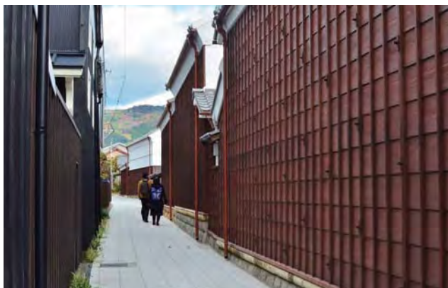
商家「駒屋」の横にある瀬古道（せこみち）の眺め。市の文化財整備（右）と住民の景観整備（左）が一体となって趣のある景観が形成された。