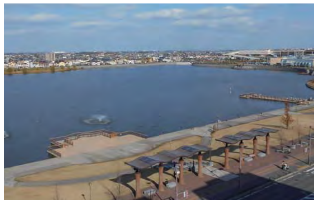
駅方向から大相模調節池を望む。地域の洪水被害軽減のために作られた人工池（大相模調節池）を街の中心に据え、広大な水面を豊かな親水空間として整備。