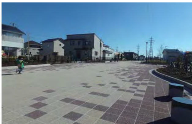
高圧線下の土地を公共用地（歩行者専用道路）として利用した四季の並木道。幅員を広く、有効的に確保することで、交流を深めるイベント等のテント設営も可能とした。