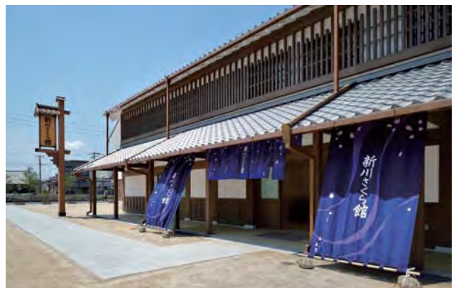
新川の地域交流拠点「新川さくら館」。お休み処や多目的ホール、集会室を備え、広場等と合わせてイベントの開催を実施。次世代に地域の歴史や文化を継承する空間となっている。