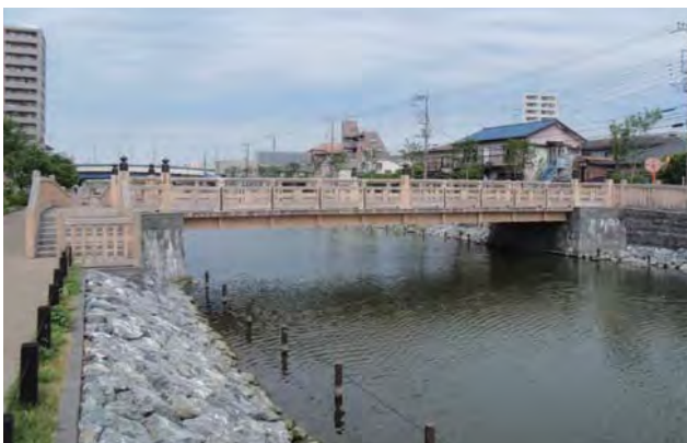
人道橋 橋台部の護岸（自然石積み護岸）。江戸情緒あふれる川辺づくりとするために、江戸風情を醸し、出す木橋及び木製高欄の形状、橋台における護岸等を整備。