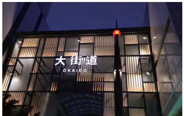
ファサードをリニューアルした大街道商店街アーケード（夜景）。鉄と木目を組み合わせた透過性のあるデザイン。