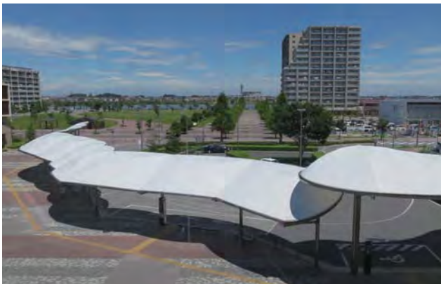
越谷レイクタウン駅から大相模調節池方面を望む。駅北口から大相模調節池が望めるよう駅前広場を整備。

ずっと以前からこの事業は知っていたし、地区内の SC（ショッピングセンター）にも来たことはあったのだけど、訪れてみて印象は強烈であった。埼玉県の特に南部地域は地形が平坦で、東京湾から標高はほとんど上がっていないため、内水排除等の洪水対策が重要な地域である。そういった地域事情を逆にとり、通常はカラ堀で殺風景な調整池を常時水面のある湖として造り出してしまった、それがレイクタウンである。越谷市の南部のこの場所に巨大な湖がある景色は不思議であるが素晴らしい。これがこの大きな区画整理地区用の調整池に加え、大相模調節池と呼ばれる元荒川の調整機能を合わせ持つ湖である。常時水面は調整池の底であるから、水面は地平から少し下の方にあるが、広々としてうまく作られているから親水性は高い。台風時には計画通り地面すれすれまで水位があがり、住民の方たちはハラハラされたようだ。人工の湖が内陸にあり、きちんと治水機能を持ち、平常時はボートを浮かべることができ、ピオトープとして多様な生物の生息環境を造り出している。視察時にも周辺の住宅地を大型の鳥が飛んでいる姿にも出会った。225ha に及ぶ特定土地区画整理事業であるから、JR 武蔵野線の駅とその駅前広場等の新設、誘致機能としてのこれまた巨大な SC など新しい街として特徴ある機能を持ち、住宅地では様々な工夫や地区計画の活用などにより良好な景観形成が取り組まれている。そしてなんといっても地区中央の湖とその畔にある公共的空間の伸びやかさ。残念なのは地区の一つの目玉機能である SC が余り湖の方を向いていない、と思えたこと位か。都市開発の可能性の高さを再確認できる街である。（高見）