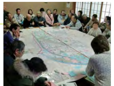
懐島エリアの大きな地図を広げ、マップ完成記念「懐島・景観まち歩き&報告会」の開催（平成22年）。

活動テーマの「まち歩きから始まる景観まちづくり」が「まち歩き音声ガイドサービス」の事業に、住民が主体となって作成した「(仮称)民話『河童徳利』ひろは」計画案の手ごたえが「景観まちづくりセンター・茅ヶ崎」実験の事業へと繋がった。