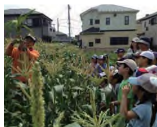
優秀賞：懐島プロジェクト —歴史・地形・生活から読み解く— 神奈川県茅ヶ崎市（懐島エリア）