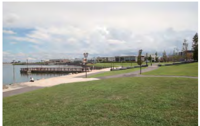
市民の憩いの場として提供している芝生広場（斜面広場）と様々な水辺の利活用の拠点となる木橋風駅。