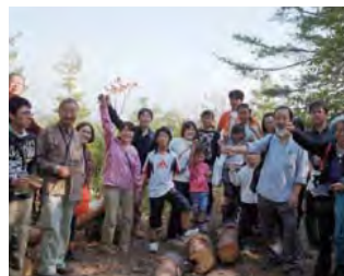
優秀賞：高校生と共に進める イザベラ・バードの古道復元活動 山形県川西町（小松地区）