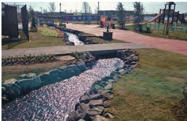
1号公園の湧水の池より南北に設けた「せせらぎ」による『水辺空間』。手押しポンプを設け、子供から大人まで親しまれるスペースを用意した。