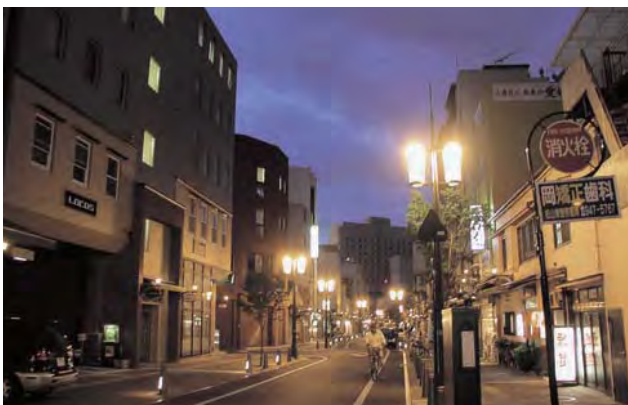
松山城へのエントランスとなるロープウェー街（夜景）。道路整備には、煉瓦・石・鉄など歴史的質感のある素材を使用。