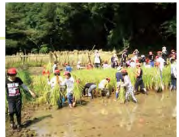
地元小学校の稲刈り体験の様子。自分たちで植えた稲を収穫。

また、定年退職後の方々が多く参加する市民団体と小さな子どもを持つ親が集まる市民団体が活動を共にすることで、かつての里山の記憶を語り継ぐ貴重な場となり始めている。