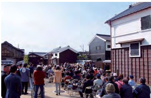
商家「駒屋」の広場でおこなわれたイベントの様子。自由に入出りできる「駒屋」の敷地は、土蔵や板塀で囲われ、心地よい空間になっている。