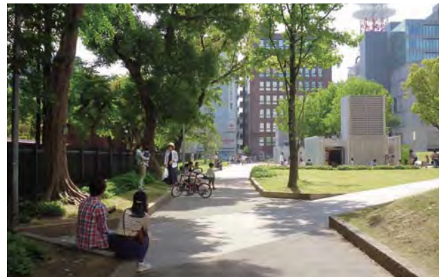
改修前は人通りがほとんど無かった南側通路の現在の様子。老朽化とともに死角を形成し犯罪の温床となっていたトイレを移設。通路自体の線形も直線化し、加えて二重の柵が張られていた警固神社との境界部を改修した。