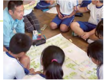
ファシリテーター（サポートチーム&地元の方）と共にアイデアを出し合う子どもたち。

当地区は東日本大震災により甚大な被害を受けた地域であり、現在も多くの課題を抱えている。復興事業は住民有志による協議の上で進められ、震災復興の指針となるランドデザインを策定、災地の造成工事が進んでおり、平成 28 年度より序々に建物が施工される予定である。そういった中、短期で考えるまちづくり（避難経路の整備や、廃れつつある地域行事の復活など）と長期で考えるまちづくり（未来の子どもたちにどのようなまちを残すのかといった議論）が進んでおり、地元の小学校である久之浜第一小学校と、建築家が多く在籍する久之浜大久地区まちづくりサポートチームが震災後のまちづくり教育で連携し、「未来のまちづくりの担い手を育てること」「まちづくりを通して考える力を育てること」を目標に授業やワークショップを共同で運営する事となった。子どもたちが「自分の住む地域の魅力を考えることの大切さと面白さを感じてもらうこと」「自分の意見を一住民（未来のまちの担い手）の意見として大人へ届けること」をテーマに本プログラムは開発された。