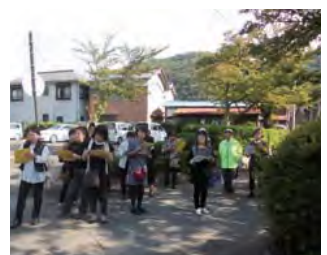
優秀賞：中山道中津川宿の景観まちづくり 岐阜県中津川市（中山道中津川宿）