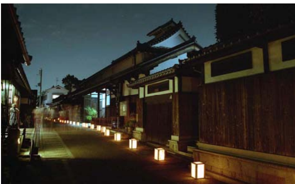
寺内町燈路。富田林寺内町をまもり・そだてる会の主催により、毎年8月に開催される。会員、協力団体及び一般参加者を含め約800個の手作り行灯が並べられている。