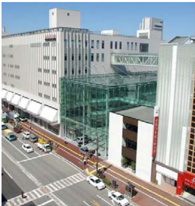
2つの再開発事業と一体的に整備された全天候型の「まちなか広場（グランドプラザ）」の外観。

こうした広場整備と活発な活動によって、地区周辺においては歩行者量が大幅に増加し、まちの賑わいを取り戻しつつある。