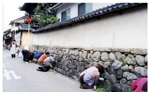
寺内町清掃活動。年に一度、富田林寺内町をまもり・そだてる会の会員を中心に寺内町地区内の清掃を行っている。