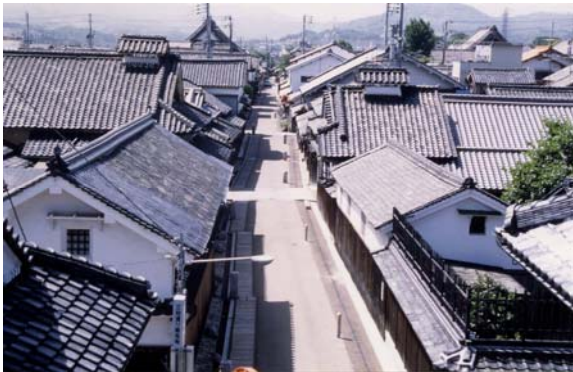
富田林寺内町（重要伝統的建造物群保存地区）。歴史的町割と連続性をもつ町並みが保存・活用されている。

また市民団体による多彩なイベント開催やボランティアガイドによる街なみ案内など様々な取り組みがなされ、まちの活性化に寄与している。