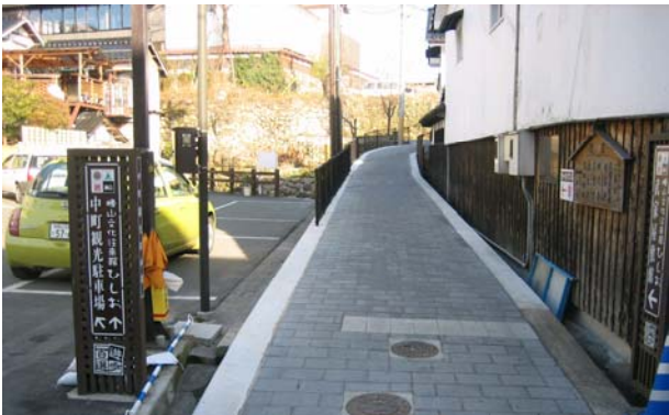
散策道。電線類の地中化、美舗装整備がなされている。