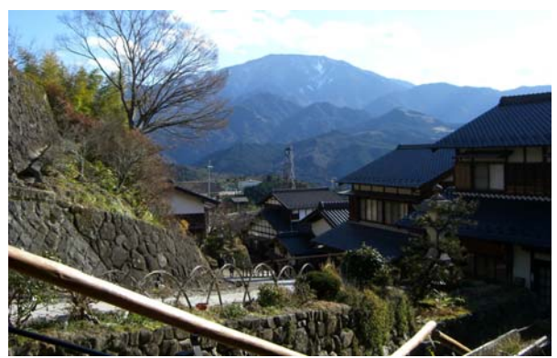
秋から冬にかけて当地区から望む恵那山。四季折々の表情を変える重要な景観資源である。