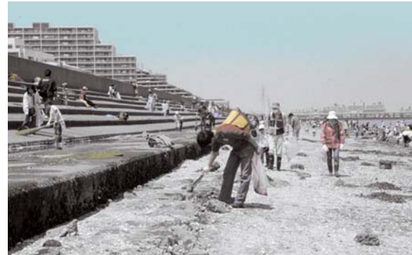
住民によるまちづくり活動。浦安三番瀬クリーンアップ大作戦実行委員会主催の干潟のゴミ拾いの様子。