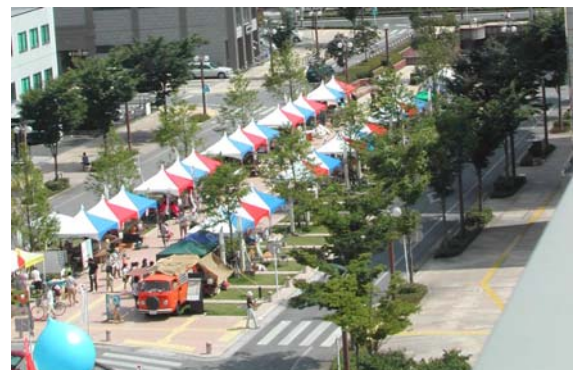
物産展で賑わうアクト通り。