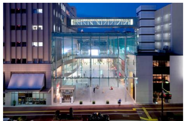
「まちなか広場（グランドプラザ）」を平和通り側より見る。