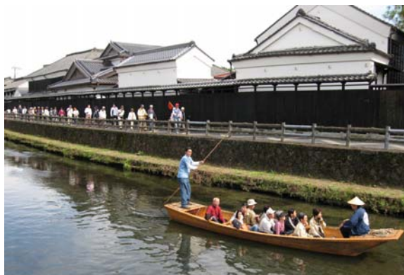
年間を通して行われる「舟行」観光。