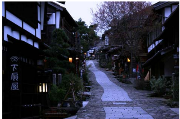
夕刻の馬籠宿。門燈と整備された石畳が街道情緒を引き立てている。