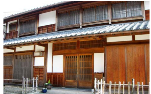
近年改築された家屋。住民協定を遵守し、景観に配慮されている。