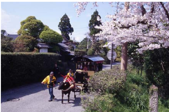
当地区を周遊する観光牛車。NPO.法人が運営しており、利用する観光客の評判が良い。