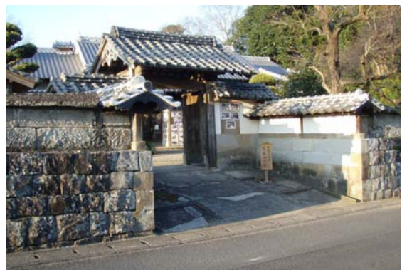
NHK大河ドラマ「篤姫」のロケ地となった「宮路邸」。