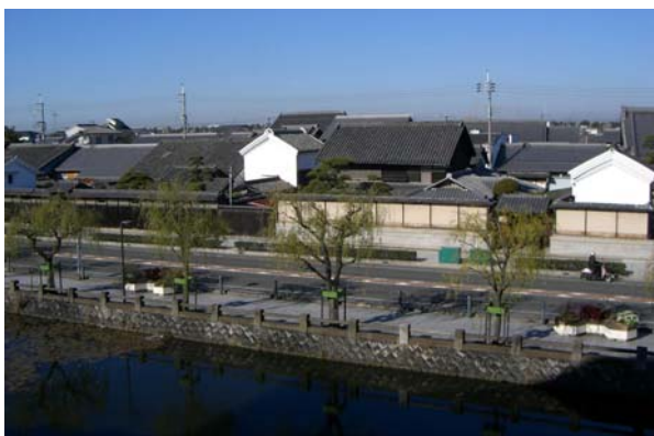
お城石垣から望む本町地区の街なみ。瓦葺の屋根と塀で構成された景観が見られる。出入口や窓が殆どなくお城との関係が現れている。

こうした歴史的まちなみを保存するため、歴史の道・歴史をめぐる遊歩道整備事業や街なみ環境整備事業を活用し、紀州街道の修景（道路舗装の美装化、電線・電柱の集約美装化等）やポケットパーク、集会施設等の施設整備とともに、家屋修景助成による歴史的建物の修景整備が進められている。また住民団体による賑わい創出のためのイベントの開催や手作業による板塀整備プロジェクトや手作り案内板の設置など様々な活動が行われ、まちの賑わい創出、住民の郷土愛意識の高揚に寄与している。