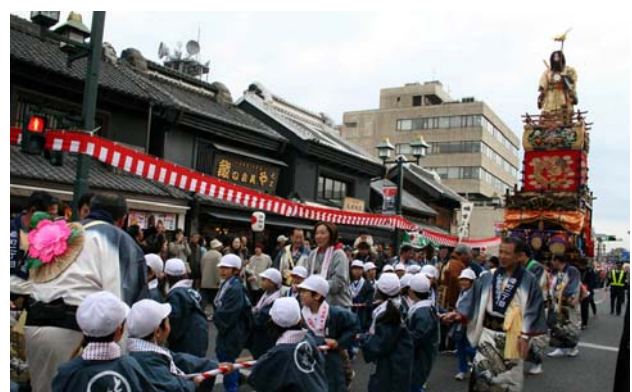
大通りを利用した「とちぎ秋祭り」。