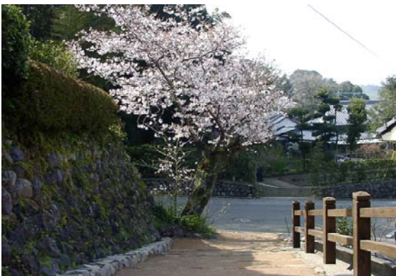
街なみ環境整備事業で整備された、うくいす谷に通じる通路。