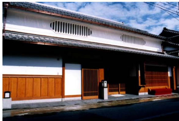
平成9年度市により開設された「まちづくりの館」。集会施設として建築され、まちづくり活動の拠点として活用されている。またトイレやロビーは一般開放されている。