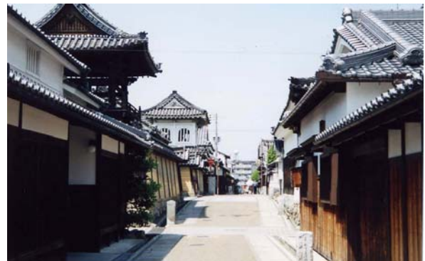
城之門筋（日本の道100選）。景観に配慮して電柱を移設し、路面の一部に石畳が敷設されている。昭和61年に『日本の道100選』に選定されている。