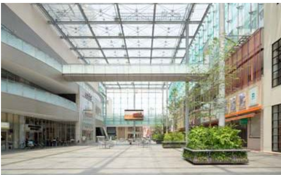
賑わいを創出するために、公有地と民有地を合わせて整備された「まちなか広場（グランドプラザ）」の全景。