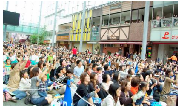
「まちなか広場（グランドプラザ）」でのイベント風景。多様なイベントが年間120以上行われており、たくさんの人が集う活気に満ちた景観を形成している。