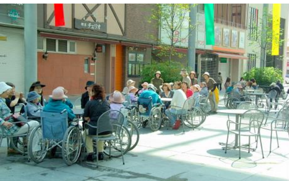
「まちなか広場（グランドプラザ）」の日常の様子。明るい日差しと爽やかな風を感じることができる都市型広場として多くの人に親しまれている。