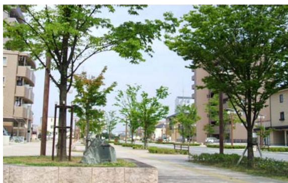
幅員40mの公園通り（馬込住吉線）歩道部分。自然石で舗装され民間の寄付により植えられた街路樹。