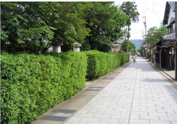
寺町通り沿いの生け垣。築地塀や板塀とともに、各寺院の前面に設けられている。