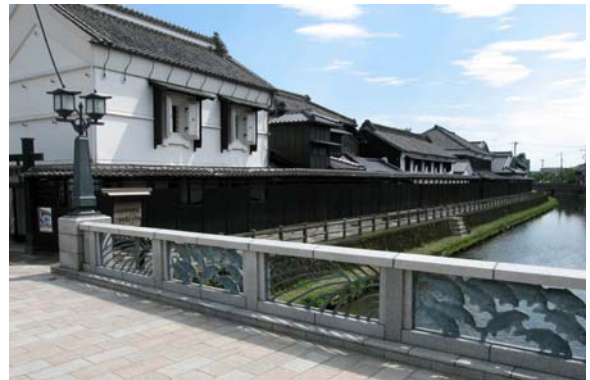
巴波川沿いの景観。歴史的建造物が建ち並び、また黒塀の修景がなされている。