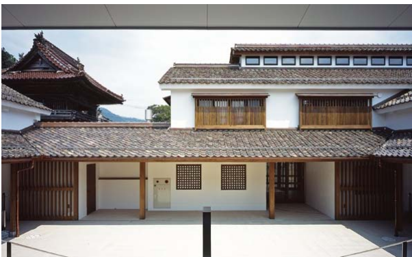
老朽化した明治時代中期の醤油蔵を改築して造られた地域交流センター「勝山文化往来館ひしお」。館内では多種多様の文化・交流活動が展開されている。