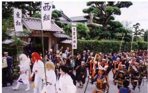
「麓祭り」。出水麓街なみ保存会により、毎年11月に開催される。