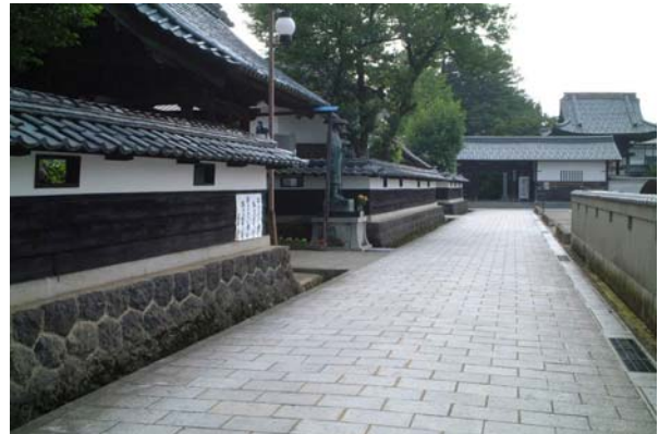
石灯笼通り西からの眺め。寺町通りと同様に石畳舗装がなされ、遠藤の寺院との調和を図っている。