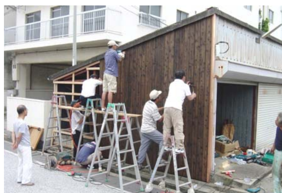
板塀プロジェクト作業中の光景。本町のまちづくりを考える会の会員の手作りにより作業を実施している。