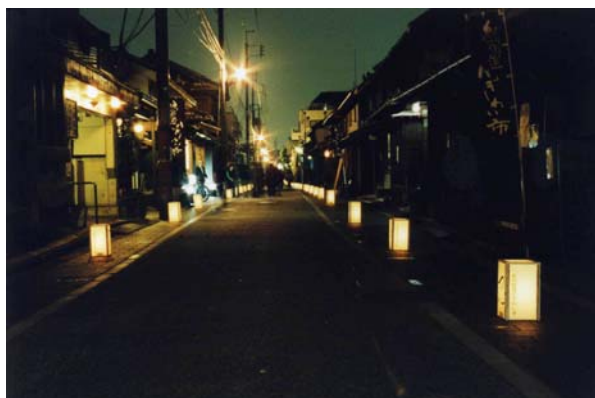
夢灯路（紀州街道にぎわい市前夜祭）の光景。平成15年から紀州街道にぎわい市の前夜祭として、手作り灯笼を並べ、夢灯路を開催している。