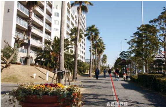
歩道幅員4.5mと壁面線後退による宅地(幅10m)を一体的に整備し、広くて開放的な歩行者空間を実現している。