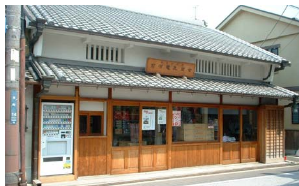
修景された商店。前面が大きな看板とサッシの出入口に覆われていた建築物を、家屋修景助成を利用してまちなみに適合したファサードに改修された。