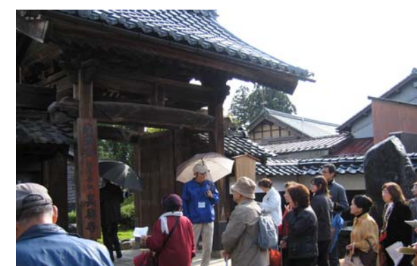
観光ボランティアガイドの説明を受ける観光客。まちなか観光の人気コースとして定着している。