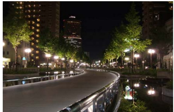
アクト通り（東1号線）は電線類が地中化され、低ボールの街路灯に照らされた街路樹がおしゃれな空間を演出し、夜のそぞろ歩きが楽しめる空間となっている。