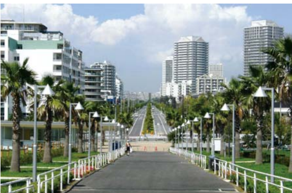
椰子類の植栽によりリゾート都市を演出。東京ディズニーリゾートのパートナーホテル4軒や温泉施設等が立地しており、地区一帯がリゾート都市的な雰囲気醸成している。