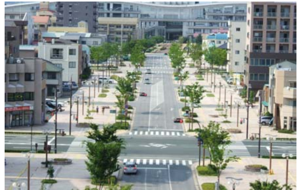
学園通り（東6号線）車道はインターロッキング、歩道は自然石で舗装され、広幅員の歩道は子どもたちの安全な通学を守っている。