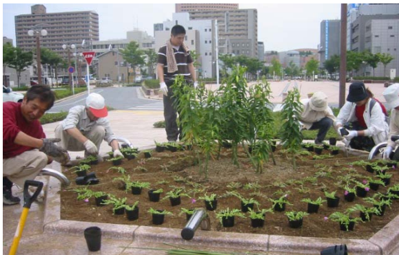
アクト通り（東1号線）の花壇は地域住民により結成された「アクト通り花くらぶ」によって四季折々の花の植栽と管理が行われている。