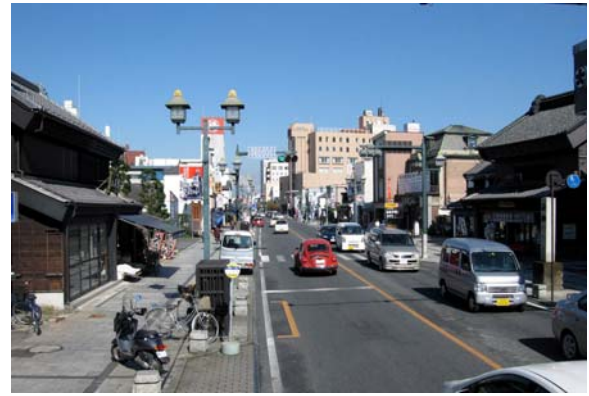
大通りの景観。シンボルロード整備により電線類の地中化、高質な歩道整備がなされ、すっきりとした景観を形成している。