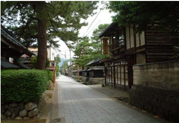
寺町通り南からの眺め。石畳舗装がなされ、沿道の寺院や伝統的民家との調和を図っている。

市の街なみ環境整備事業等を契機に、住民が中心となって、地区内の建築物を改修する際のルールとなる「まちづくり協定」を締結し、協定に沿った改修に対して工事費の一部を行政が補助するなど、住民と行政が一体となって景観に対する取り組みを進めている。また、伝統的な景観を活かした多彩なイベントを開催し、まちなかの賑わい創出とまちなか観光客の誘致に貢献している。