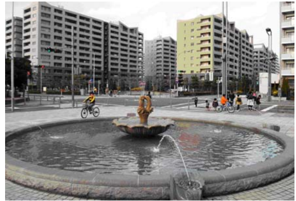
高層住宅敷地の一角に確保された辻空間。大きな噴水を配置することで、夏は歩行者に潤いと清涼感を与えている。管理は居住者で構成する管理組合で行っている。