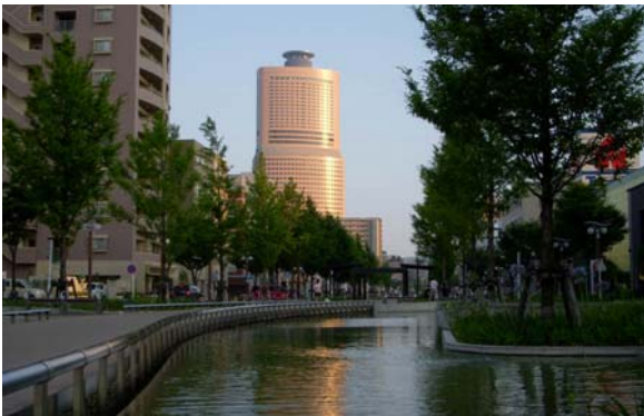
アクト通り（東1号線）の北側エリアには水上回廊があり静かなやすらぎ空間となっている。

地区のシンボル道路であるアクト通り（幅員40m）は、道路中央に幅員18mの歩道、水上回廊、中央広場などが整備されており、この空間を活用して市民協働による多彩なイベント開催や維持管理活動が行われている。こうした魅力ある美しい街並みの整備によって、地区内の歩行者だけでなく定住人口も増加傾向にあり、新しい賑わいの拠点となっている。