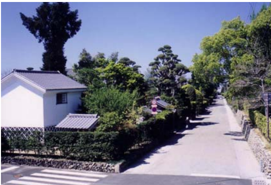
豎馬場通りとその両側に築かれた石垣や生垣。手前の蔵は公開武家屋敷「竹添邸」の一部。

通りや伝統的建造物が、NHK大河ドラマ「篤姫」のロケ地としても利用され、観光客の立ち寄り数が増加している。