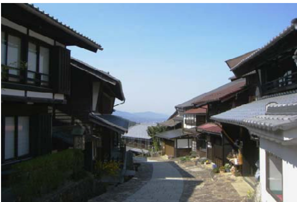
伝統的な平入り切妻の日本家屋が街道に沿って建ち並んでいる。

整備された街道等を活かして、「ふるさと馬籠ごへー祭り」、「中山道まつり」など多彩なイベントが開催され、町並みの賑わい形成に寄与している。