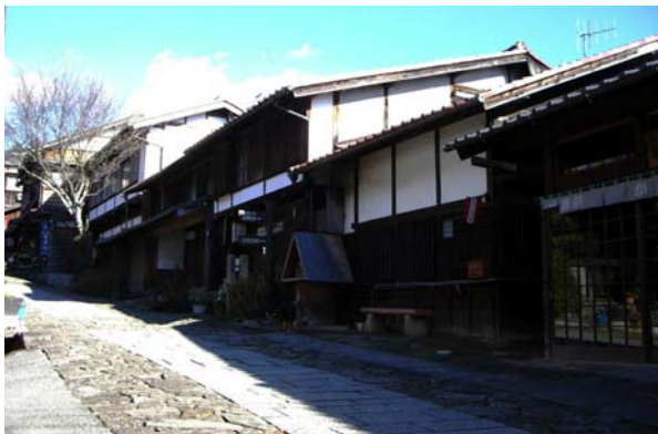
建物の高さを坂の上の家屋より下の家屋を低くすることで、町並みのバランスを保ち、景観の連続性を生んでいる。