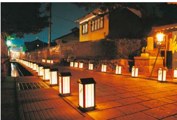
灯りのイベント「万灯会」。平成11年から毎年8月に実施しており、多くの観光客が訪れている。