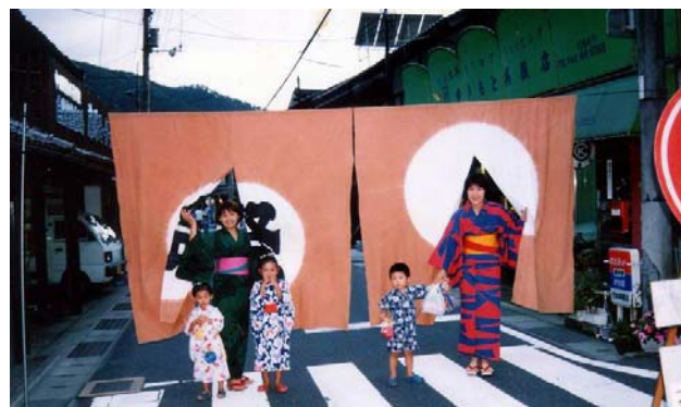
天神祭りへの参加