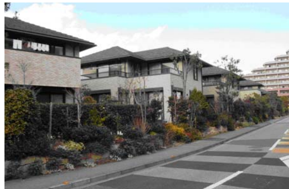
戸建て住宅地の街並み。土地譲渡時の建設指針で建物色彩の誘導、勾配屋根・無電中化を義務付け、民間事業者が建築協定、緑地協定を定めて住民に引き継いでいる。