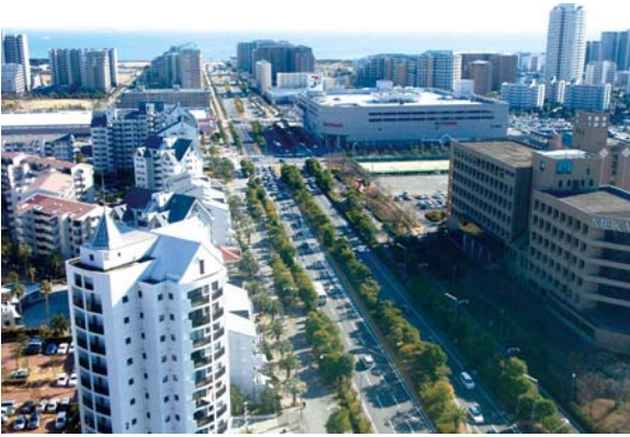
東京湾まで続く幅員50mのシンボルロードと沿道の街並み。歩道幅員約11mと沿道施設の壁面後退による宅地(幅10m)を一体的に整備し、緑豊かで広い空が実感できる歩行者空間を実現している。

人口の定着とともに、まちづくりや景観形成に関心を持つ住民グループなどが組織化されており、景観の維持・形成、コミュニティ形成、地域文化創出といった活動が活発化している。