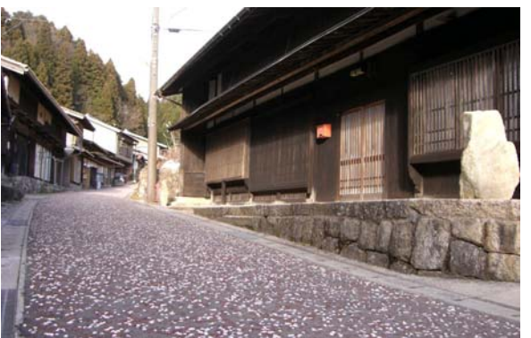
当時を偲ばせる落ち葉に埋もれた中山道をイメージした特殊舗装。この舗装を迎れば観光客が道に迷うことなく中山道を歩くことができる。(峠地区)