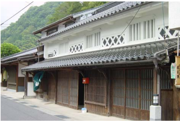
伝統的建造物の町並み。

歴史的資産を生かしつつ、まちづくり交付金事業による電線類地中化、散策道的美装化整備、文化交流施設の整備などとともに、建物外観の修理修景助成事業などが実施されている。また、住民団体による多彩なイベント活動、保存地区内の空き家の管理運営、暖簾のまちづくり事業など様々な取り組みが行われており、観光客の増加、住民自らの生活文化の質的向上に寄与している。