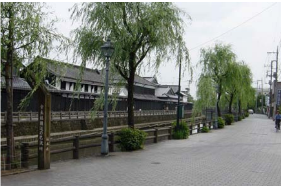
巴波川沿いの景観。遊歩道が整備され、背後の歴史的建物とともに美しい景観を形成している。