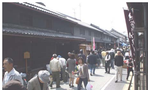
「紀州街道にぎわい市」の様子。平成10年から本町を考える会を中心に毎年4月第1日曜日に開催されている。3万人を越える人出があり地域の恒例行事となっている。