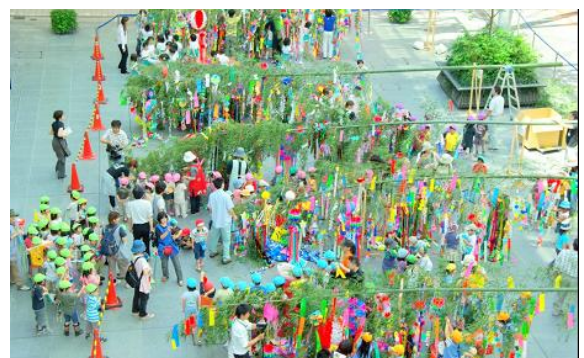
「まちなか広場（グランドプラザ）」でのイベント風景。七夕の時期に行われた「大きな大きな七夕祭り」。子供たちの作品を見ようと子供たちとその家族で賑わった。