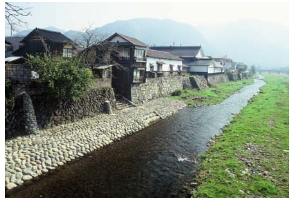
高瀬舟の発着場跡。