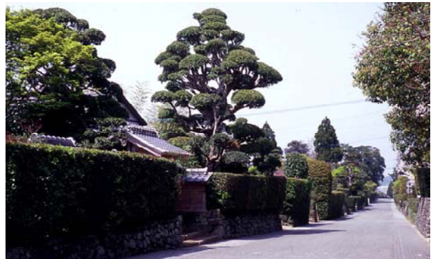
通りの両側に築かれた石垣や生垣。鬱蒼と繁る屋敷木が武家門や武家屋敷とあいまって、落ち着いた雰囲気を出している。