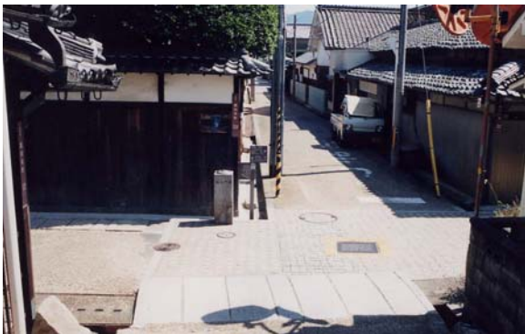
あてまげの辻。街路を直行させず半間ほどずらし、わざと見通しを妨げ外部からの侵入者をかく乱し、町を外敵から守る工夫としてつくられたいわゆる「食い違い道路」が往時のまま残されている。