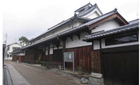
重要文化財旧杉山家住宅。地区でもっとも古い町家建築を有する。寺内町の創立に関わった八人衆の一人である杉山家の歴史は、残されている古文書によると江戸時代初期の寛永21年に遡ることができる。