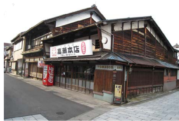
寺町通り沿いに残る伝統的な町家住宅。今後、市の助成制度を活用した修景が期待される。