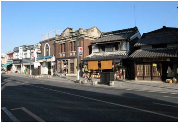
大通りの景観。江戸～明治期の蔵や大正時代の洋館などが建ち並ぶ。

整備された大通りや歴史的建造物、巴波川を活用して、多様な市民団体による四季折々の多彩なイベントが開催されており、交流人口の増加や商業の活性化に寄与している。